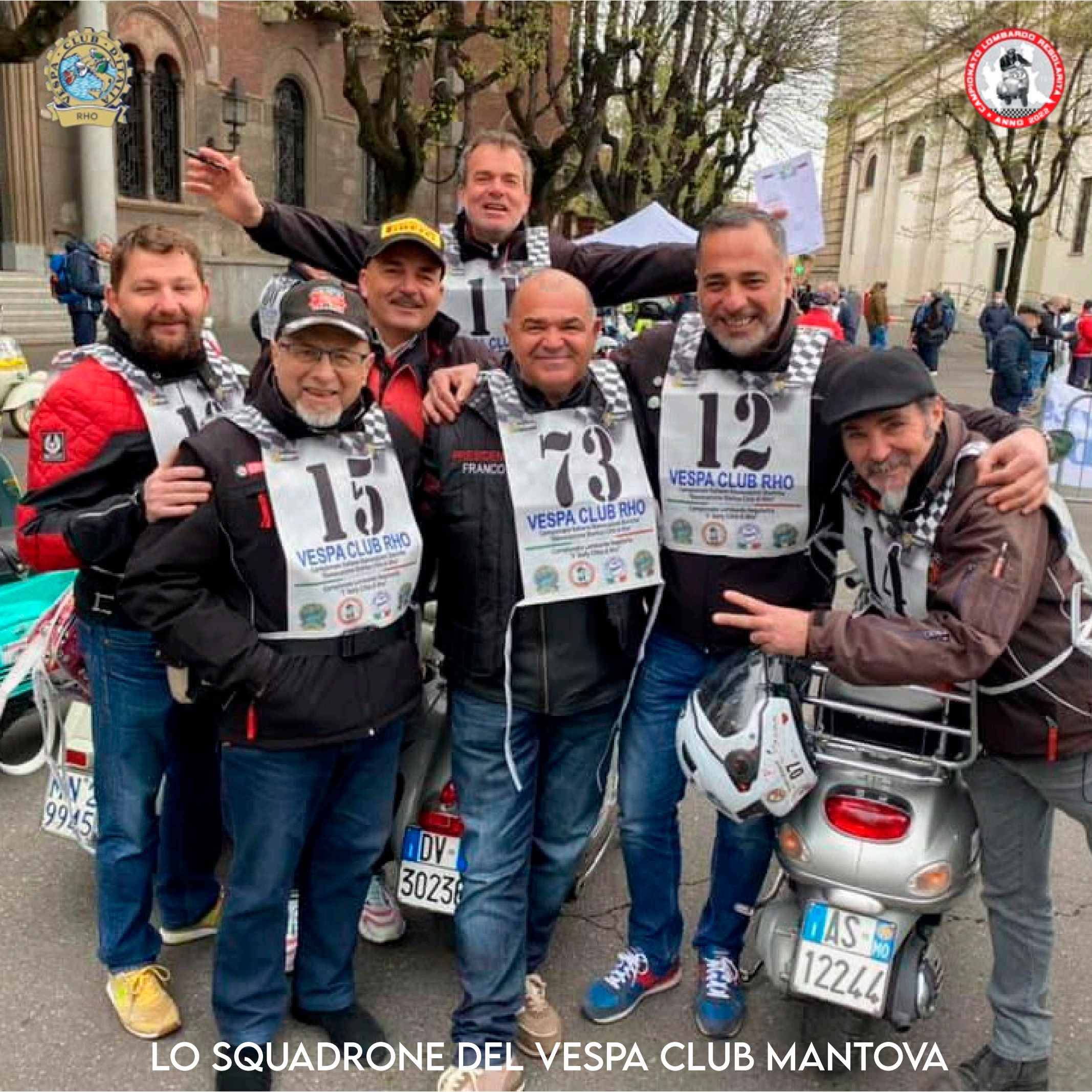
LO SQUADRONE DEL VESPA CLUB MANTOVA