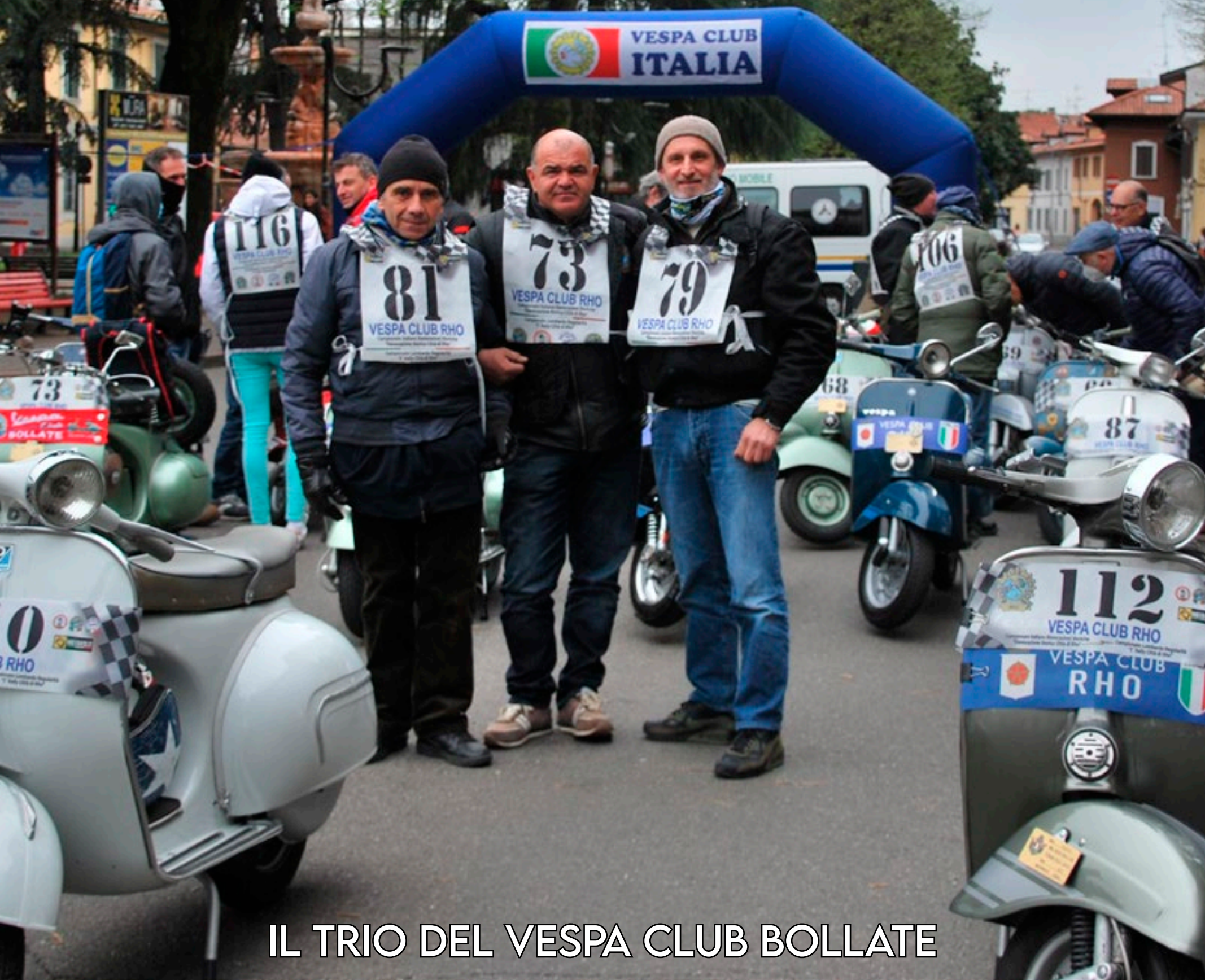
IL TRIO DEL VESPA CLUB BOLLATE