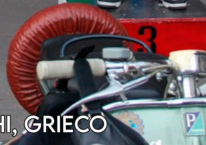
PODIO PROMO: IEMBO, STUCCHI, GRIECO