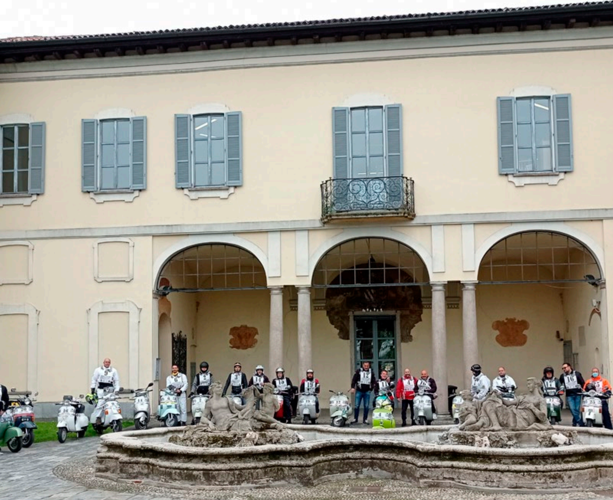
FOTO RICORDO A VILLA BURBA