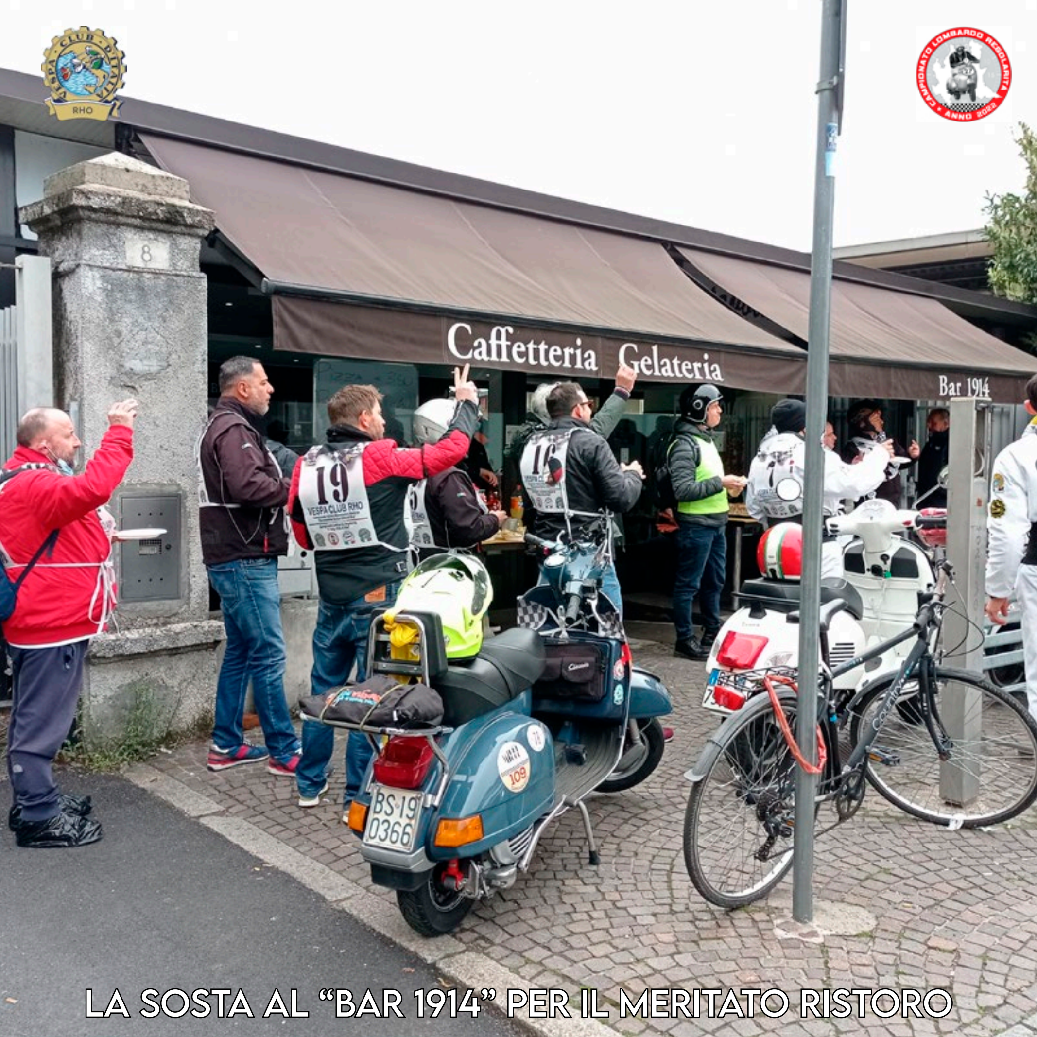
LA SOSTA AL "BAR 1914" PER IL MERITATO RISTORO