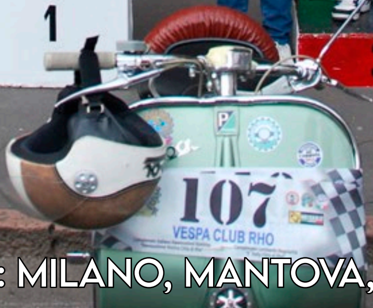
PODIO SQUADRE: MILANO, MANTOVA, RHO