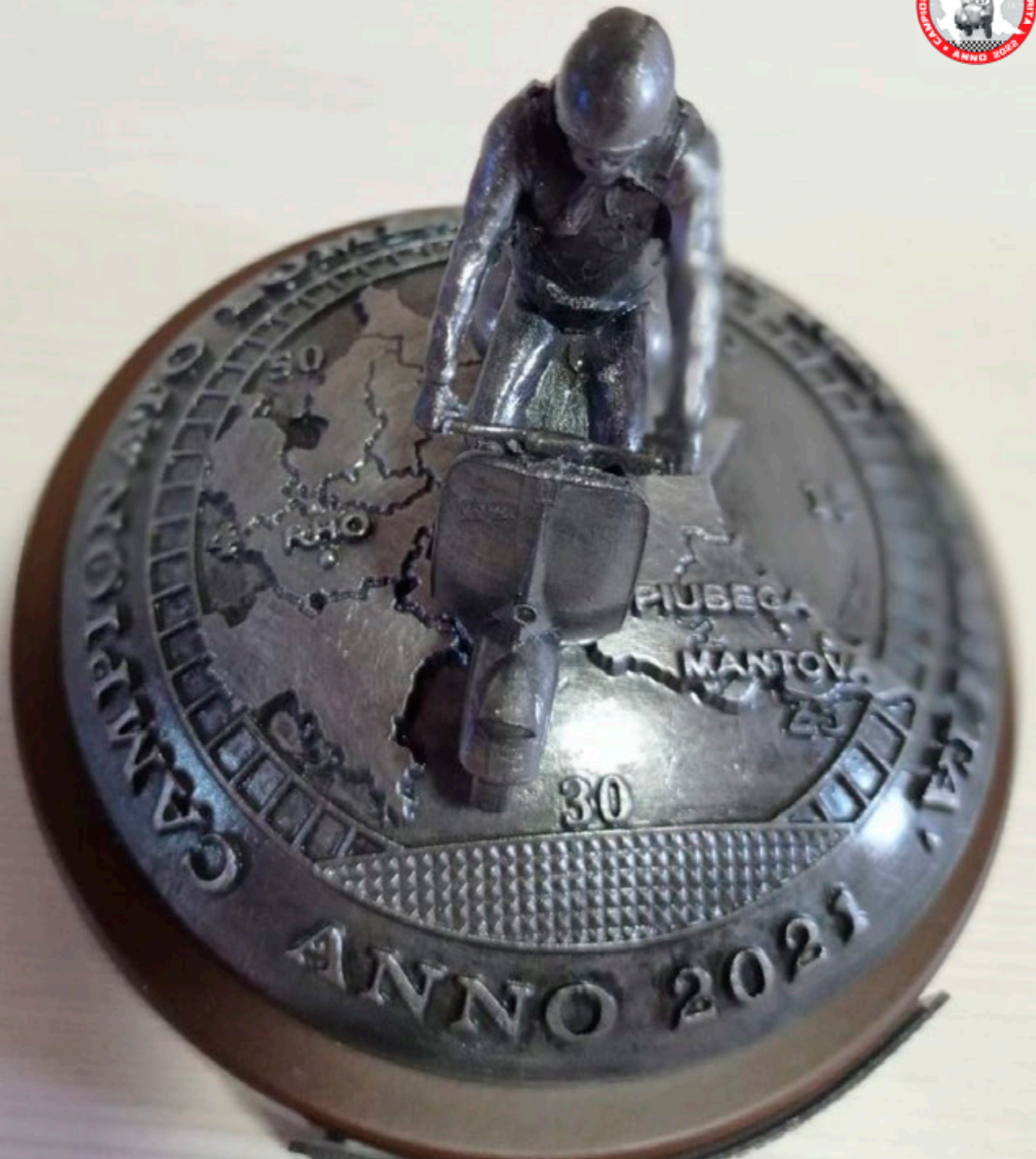
IL PREMIO PER IL CLR 2021