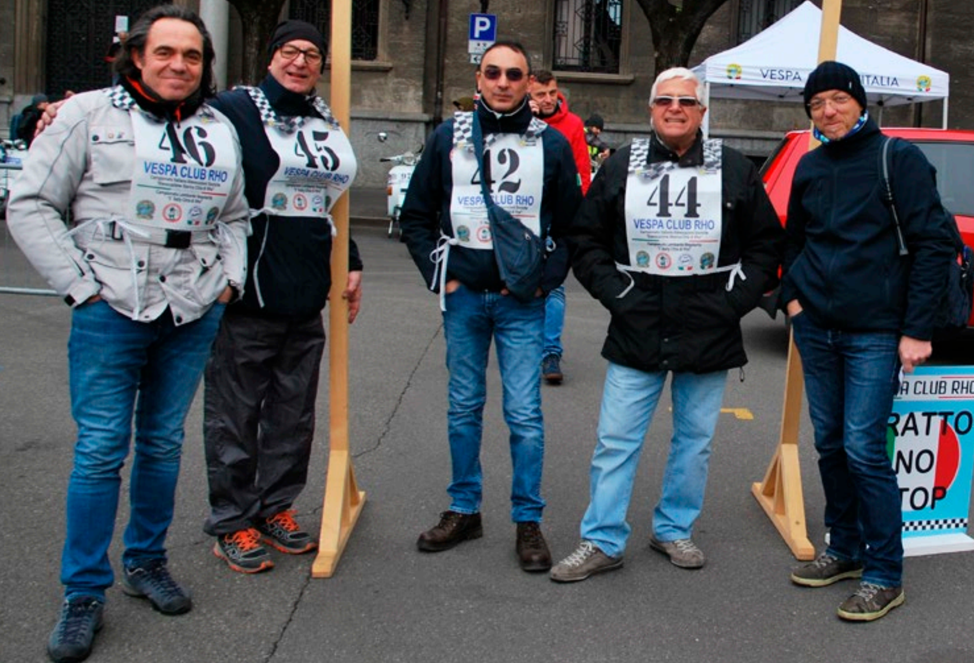
NELL'ATTESA, FOTO RICORDO DEGLI "AMICI IN VESPA"