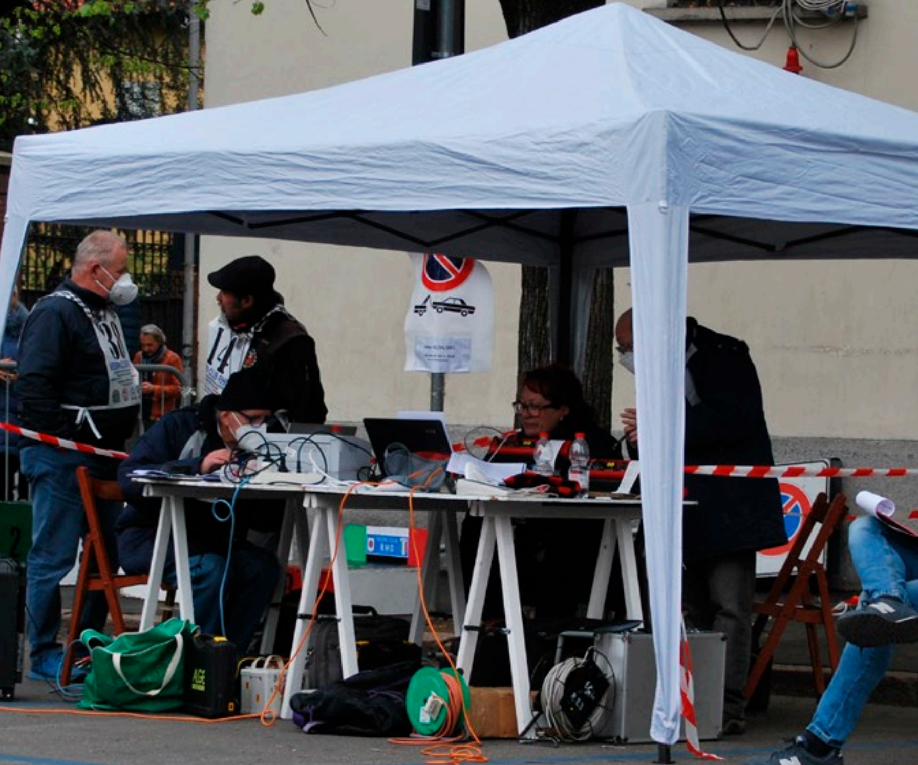
IL TAVOLO DEI CRONOMETRISTI