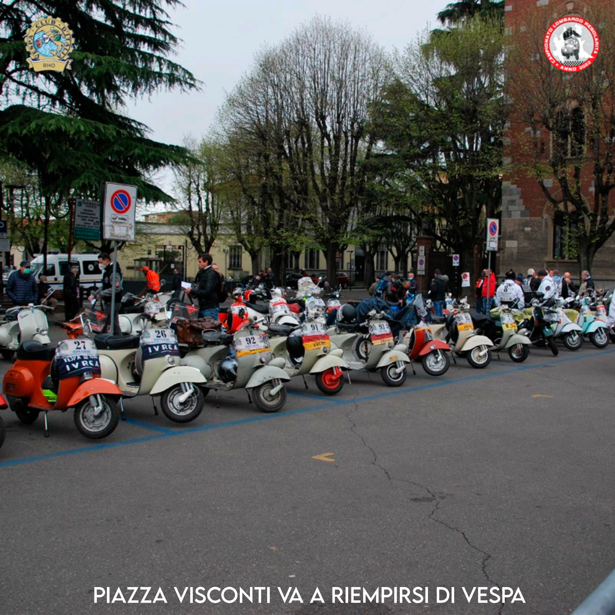
PIAZZA VISCONTI VA A RIEMPIRSI DI VESPA