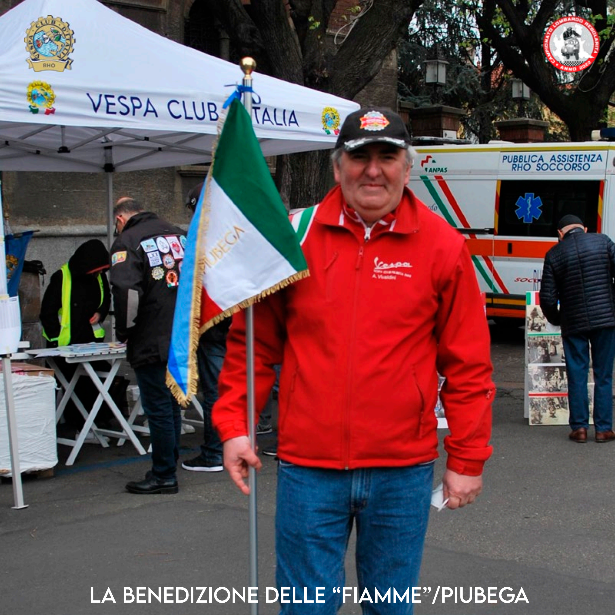
LA BENEDIZIONE DELLE "FIAMME"/PIUBEGA